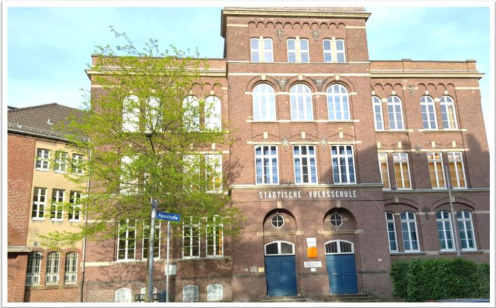
Europaschule KGS Passstraße Aachen